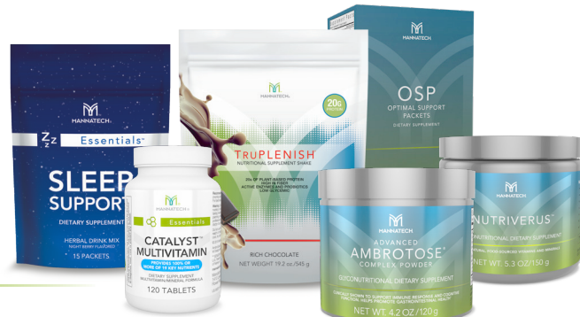
上图所示为美国市场产品